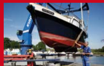
Werftservice in der Marina Niderviller