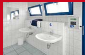
Modern ausgestattete Sanitärräume