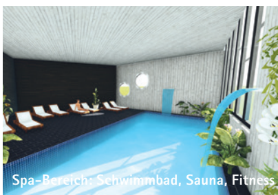
Spa-Bereich: Schwimmbad, Sauna, Fitness