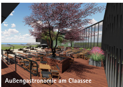
Außengastronomie am Claasee