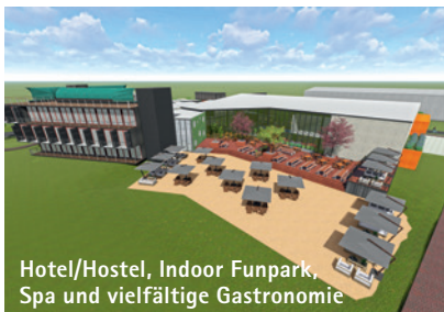
Hotel/Hostel, Indoor Funpark, Spa und vielfältige Gastronomie