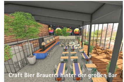
Craft Bier Brauerei hinter der großen Bar