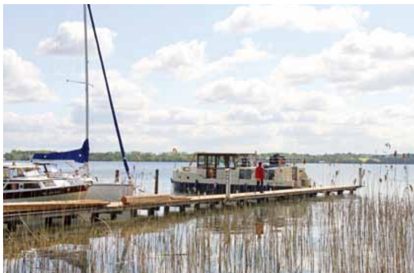
Mittagspause im Sommergarten des Yachthafens Paulsdamm zwischen Schweriner Innen- und Außensee